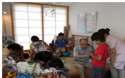
地域交流施設のイメージ