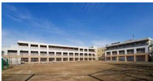
学校を改修して整備した事例